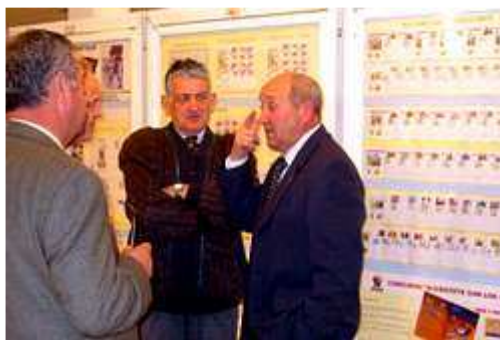
Una instantánea de la inauguración de la Exposición

1. Exposición de Filatelia para escolares en Ferrol. El pasado lunes 4 de abril, en el centro cultural Carballo Calero una exposición que se mantendrá durante todo el mes de abril. Lleva por título "Correspondencia epistolar escolar" y despertará el interés de los escolares que la visiten. La exposición, organizada por el departamento municipal de Cultura, puede visitarse durante las próximas semanas en el local del centro cultural del barrio de O Inferniño.