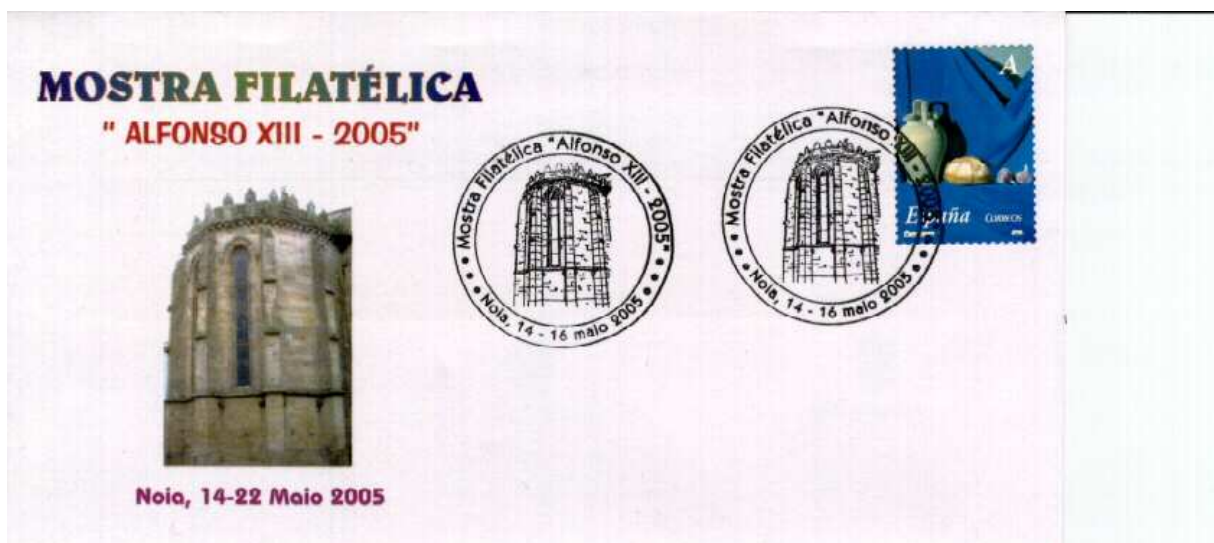
Sobre y matasellos conmemorativo de la Exposición "Alfonso XIII – 2005" Reproduce el ábside de la iglesia parroquial de San Martín de Noia