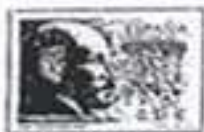
"Ramón y Cajal"

Fecha emisión: 20 Marzo 2003. Valores: 0,51 y 0,76 Eur. Tirada: 1.200.000 de cada valor. Papel: Estucado, engomado, mate, fosforescente. Estampación: Calcografía y offset. Tamaño de los sellos: 41,66x31,25 mm (horiz.).